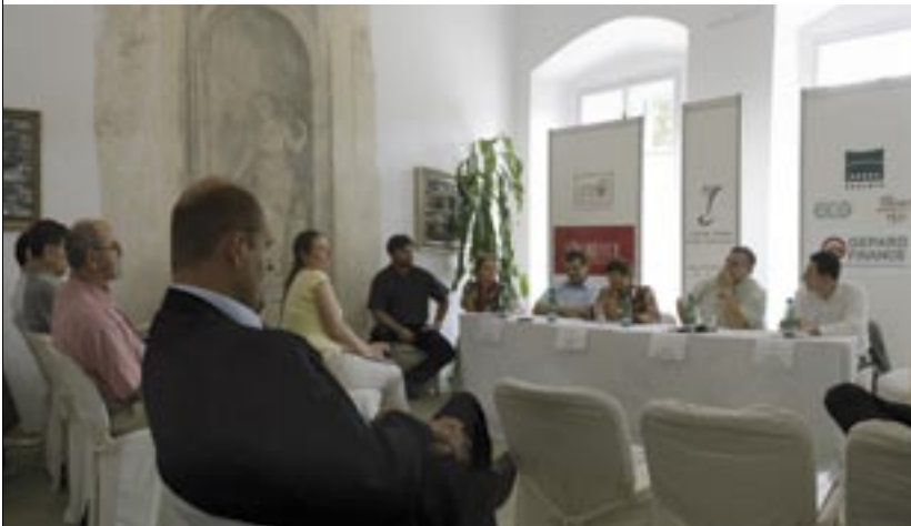
Tisková konference po skončení hodnocení potvrdila, že mezinárodní složení komise přináší řadu zajímavých názorů, které mohou být pro domácí vinaře i degustátory velmi inspirativní.